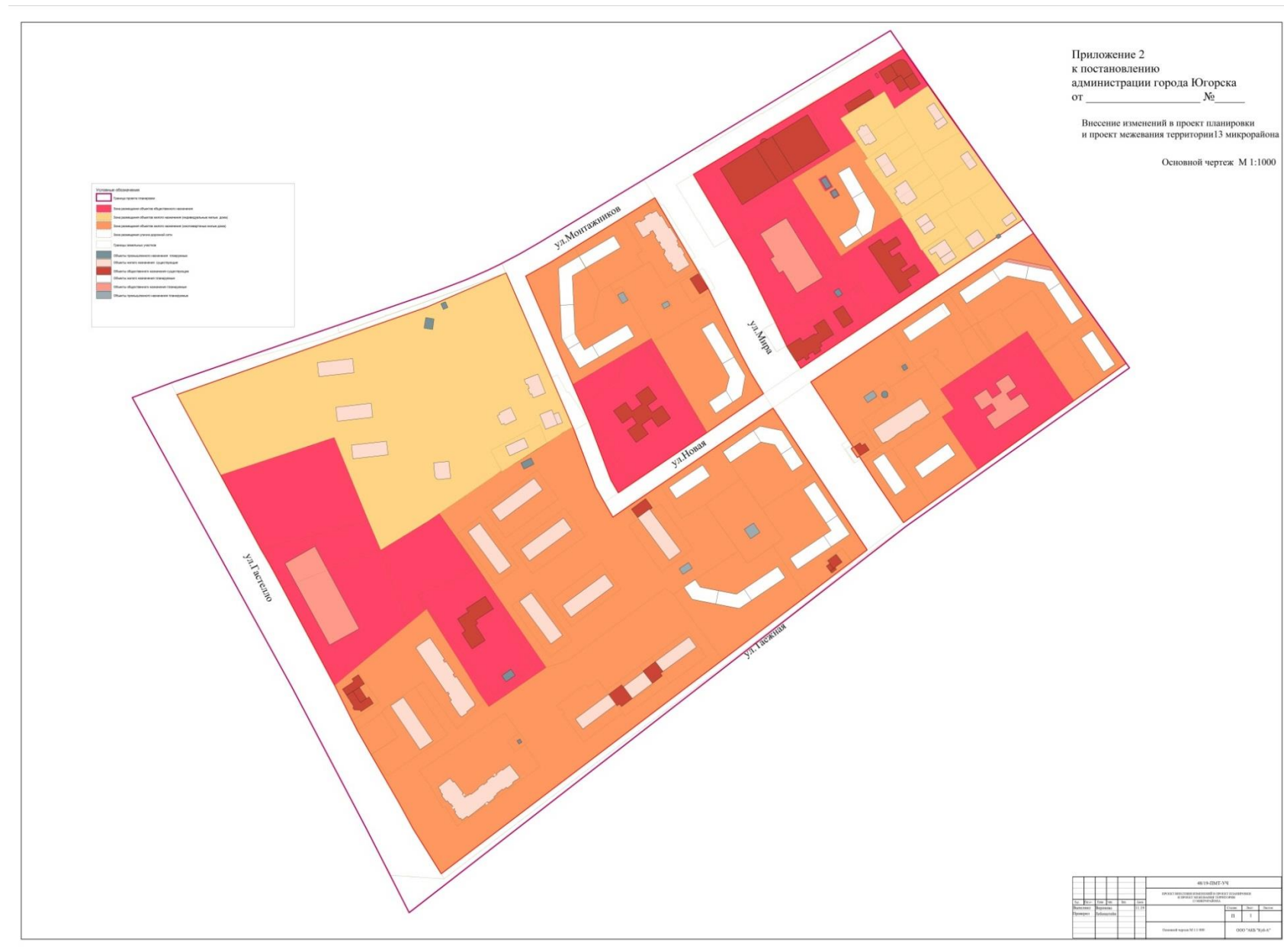
Чертеж 1 Основной чертеж планировки территории

Приложение 2 к постановлению администрации города Югорска от 24.11.2014 № 6385